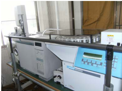
ガスクロマトグラフ質量分析計

pH、SS、COD、BOD、n-ヘキサン抽出物質等の一般項目 カドミウム、鉛、砒素等の重金属 トリクロロエチレン、ベンゼン等の有機塩素化合物 シマジン、チウラム等の農薬等