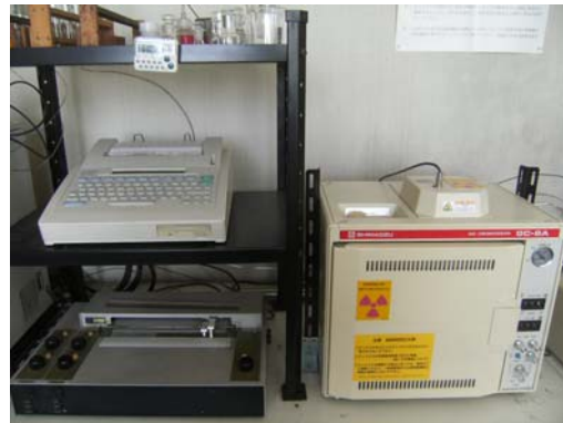
ガスクロマトグラフ・ECD